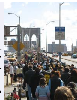
Masz Szansę Spacer 2006 (Have a Chance Walk 2006), za pozwoleniem Fundacji Masz Szansę (Have a Chance Foundation)