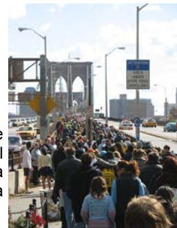
La passejada "Have a Chance Walk 2006", cortesia de la Fundació "Have a Chance" (Dóna una oportunitat).

Com a part de la Setmana de Conscienciació i durant el 2007 el convidem a participar en una Marxa al Voltant del Món per lluitar contra els Tumors Cerebrals.