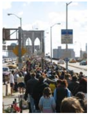
Have a Chance Walk 2006.

Non ti stiamo chiedendo di percorrere individualmente la circonferenza della terra, dopo tutto è solo 40.000 km all'equatore!